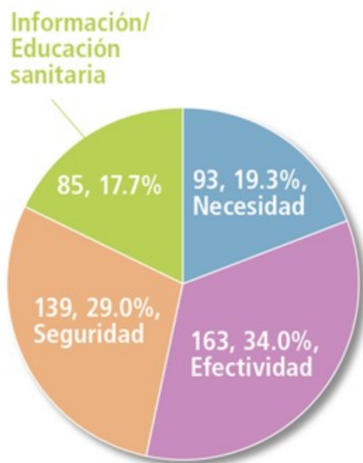
Figura 1. Proporción de las causas de derivación al médico relacionadas con la necesidad o no de un medicamento, con la efectividad, con la seguridad y con la información/educación sanitaria.

Las causas de derivación más frecuentemente implicadas fueron las relacionadas con la efectividad de los medicamentos y la seguridad, si bien las relacionadas con necesidad y con información/educación sanitaria no fueron minoritarias.