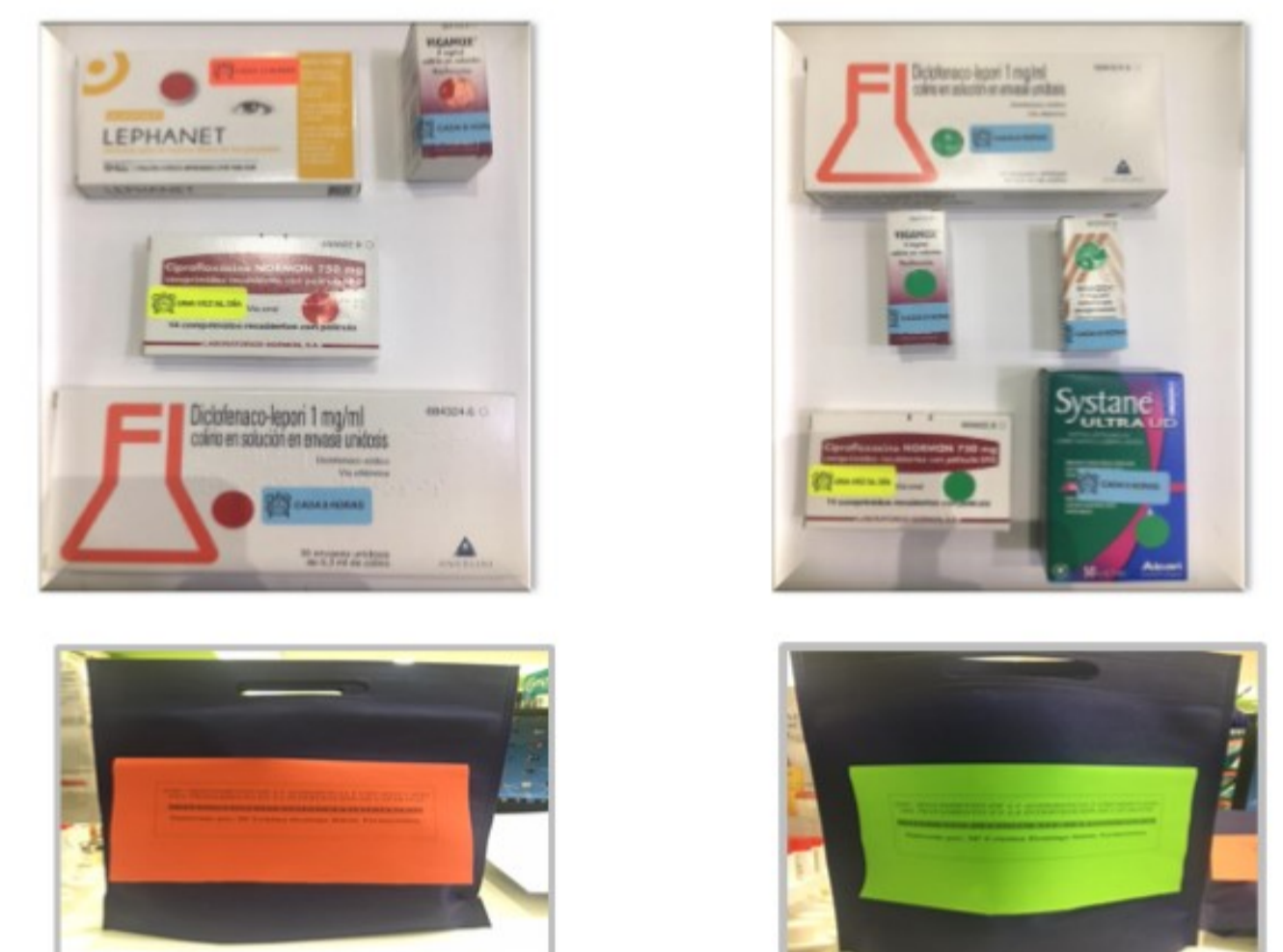
Figura 3. Bolsa de medicación del SAIC