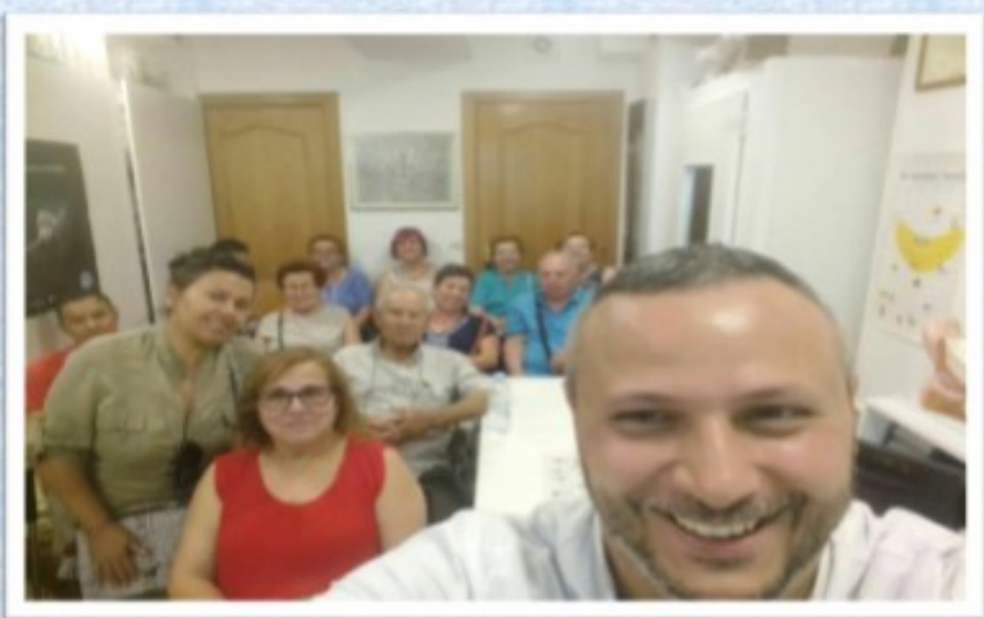
Charlas de ojo rojo desde Oficina de Farmacia