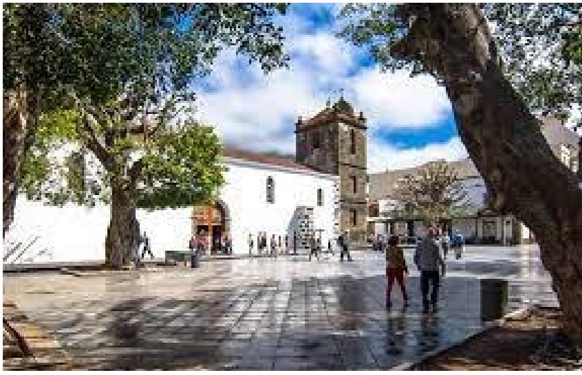
Los Llanos de Aridane

También se le entregará una tarjeta de resultados del paciente donde los FC voluntarios de los servicios de medición del porcentaje de saturación de oxígeno y de la presión arterial les anotarán los resultados de las mediciones.