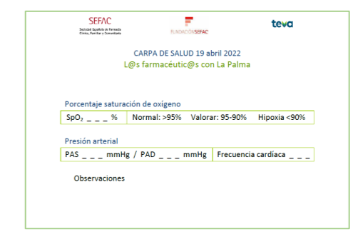
Tarjeta resultados paciente