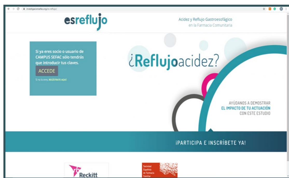
Fig.1 Plataforma de registro de casos