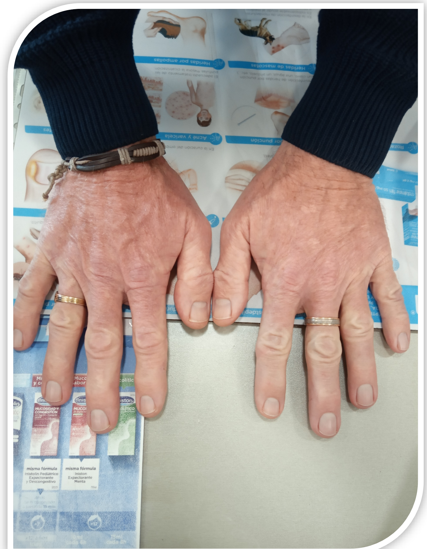
Figura 3: Foto de las manos del paciente sin lesiones el 5/2/22.

Sin embargo, la gran mayoría de estas actuaciones/intervenciones no se registran en el día a día y quizá no se visualizan lo suficiente como para que la Administración termine de valorar el gran potencial que tiene el farmacéutico comunitario en materia de atención primaria. Es vital promocionar y trabajar en iniciativas como los premios Foro AF-FC o proyectos como INDICA+PRO o Mi Farmacia Asistencial, que buscan registrar todas estas actuaciones/intervenciones a pie de mostrador y demostrarnos, a nosotros mismos en primera instancia, al resto de profesionales sanitarios, a la Administración y a la sociedad en su conjunto, el enorme potencial y futuro que tiene la FC en nuestro país, totalmente asistencial.