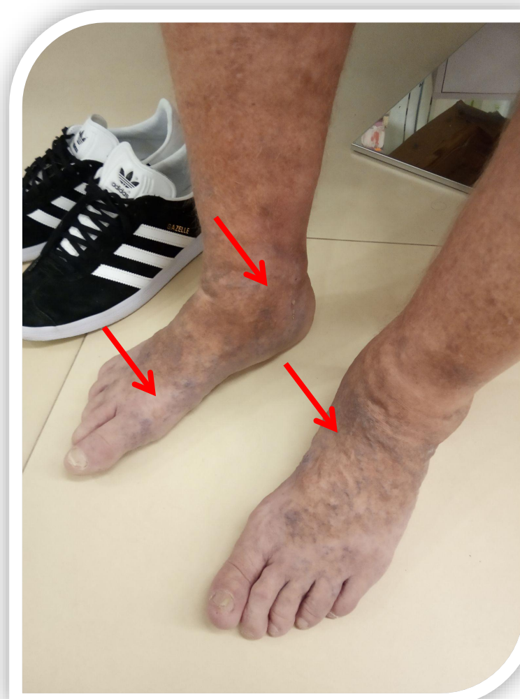
Figuras 1 y 2: Lesiones del paciente, antes y después. (Izquierda 11/12/2021 ; derecha 31/12/21)