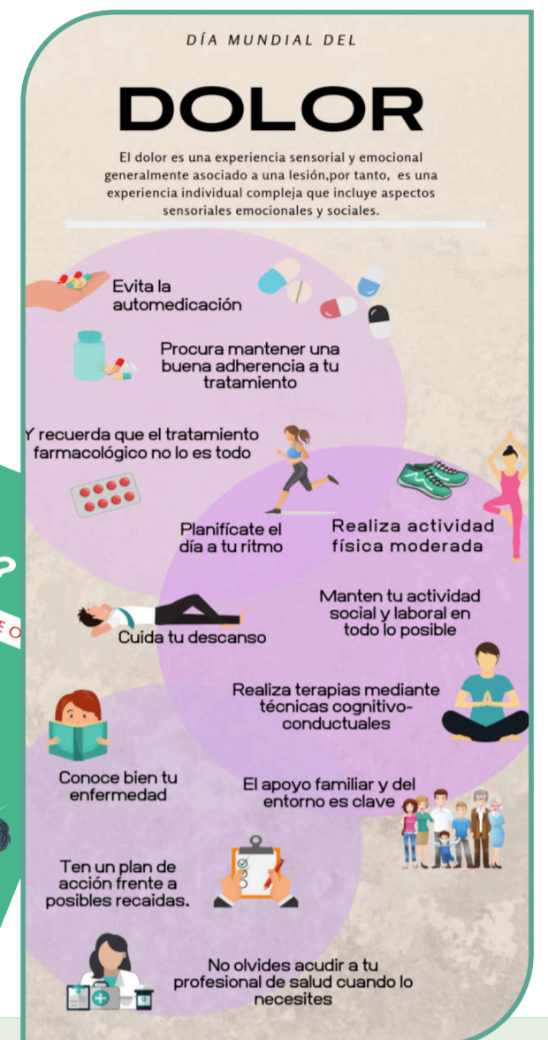
Duración del dolor