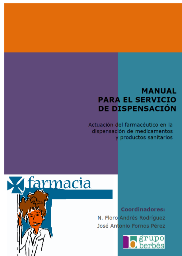
Manual del curso

Análisis estadístico: SPSS®22.0. Las variables cuantitativas se expresan como media \pm desviación estándar, las cualitativas como porcentajes (%). Para el análisis de variables categóricas, test de la chi cuadrado y para las variables cuantitativas la t de Student. Significación estadística p < 0,05 .