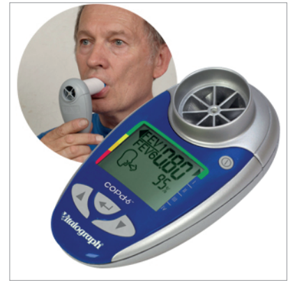
Figura 1. Dispositivo electrónico Vitalograph COPD-6

Identificar pacientes de EPOC no diagnosticados, mediante un servicio de cribado de EPOC ofrecido por